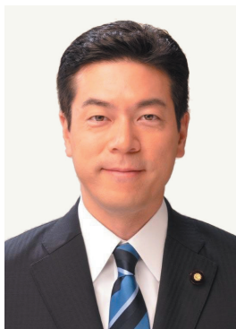
参議院議員 愛知 治郎 あいち じろう

自民党青年局長 1974(昭和49)年、石川県能美市生まれ。東北大学法学部を卒業。石川県小松市の中小企業に入社。日本青年会議所石川ブロック協議会会長などを務め、2012(平成24)年の衆議院選挙で石川2区から立候補し初当選。高校時代の同級生と結婚、小学生の息子がいる。