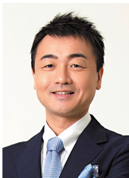
衆議院議員 佐々木 紀 ささき はじめ

自民党青年局長 1974(昭和49)年、石川県能美市生まれ。東北大学法学部を卒業。石川県小松市の中小企業に入社。日本青年会議所石川ブロック協議会会長などを務め、2012(平成24)年の衆議院選挙で石川2区から立候補し初当選。高校時代の同級生と結婚、小学生の息子がいる。